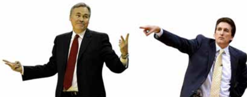
Vinny contro Mike : da "Treviso lo Ci Sono" al derby di L.A.

Proprio qui nel '79 si inizio' la grande epopea del basket trevigiano